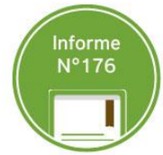
Avance de cosecha MAÍZ al 13/8: 2018/19 vs Histórico 2013/19